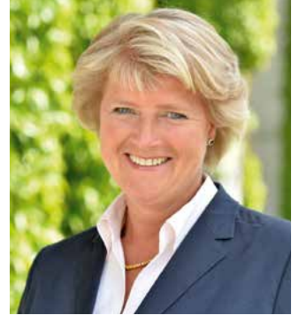
Prof. Monika Grütters MdB

Prof. Monika Grütters MdB Staatsministerin bei der Bundeskanzlerin